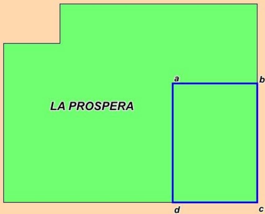
Tav. 1 – Permesso di ricerca «LA PROSPERA»