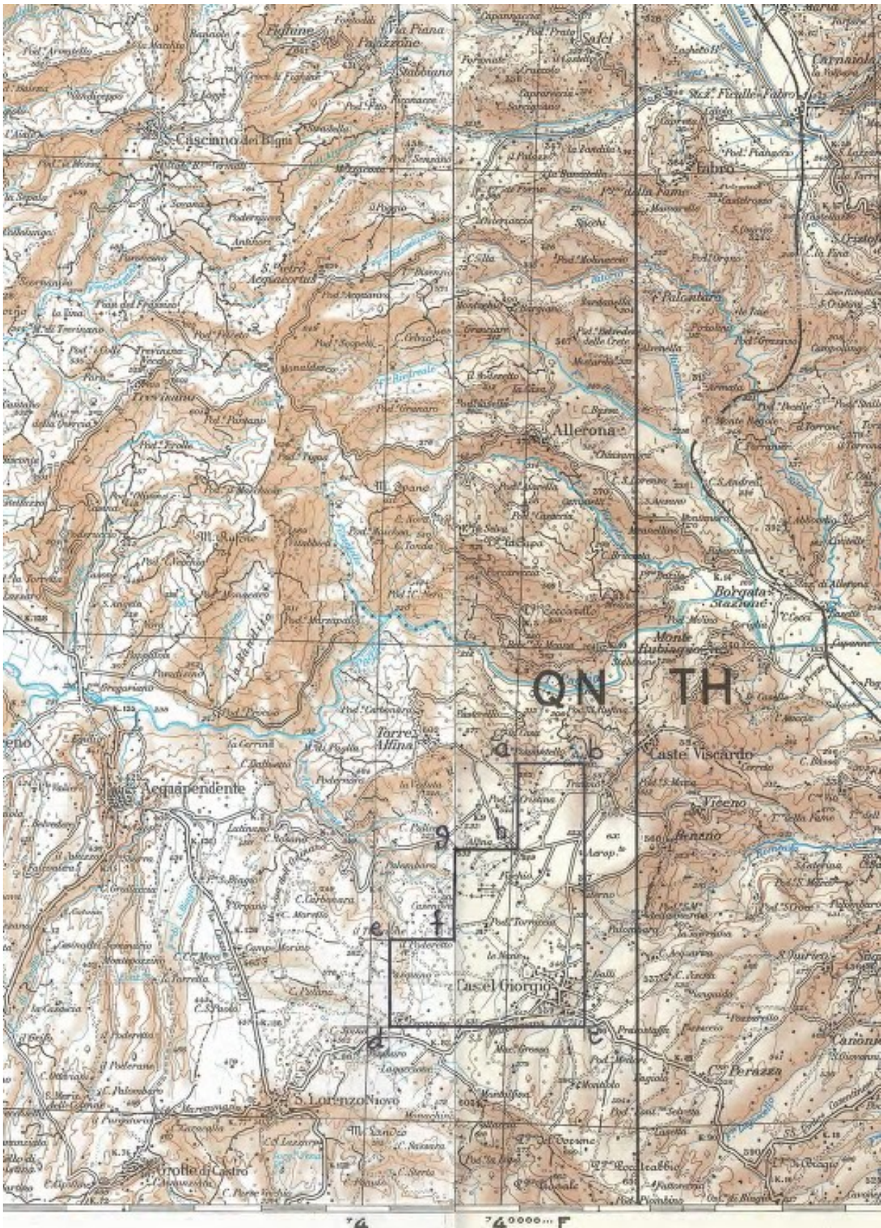
Tav. 2 - Permesso di ricerca di risorse geotermiche finalizzato alla sperimentazione di impianti pilota «CASTEL GIORGIO»