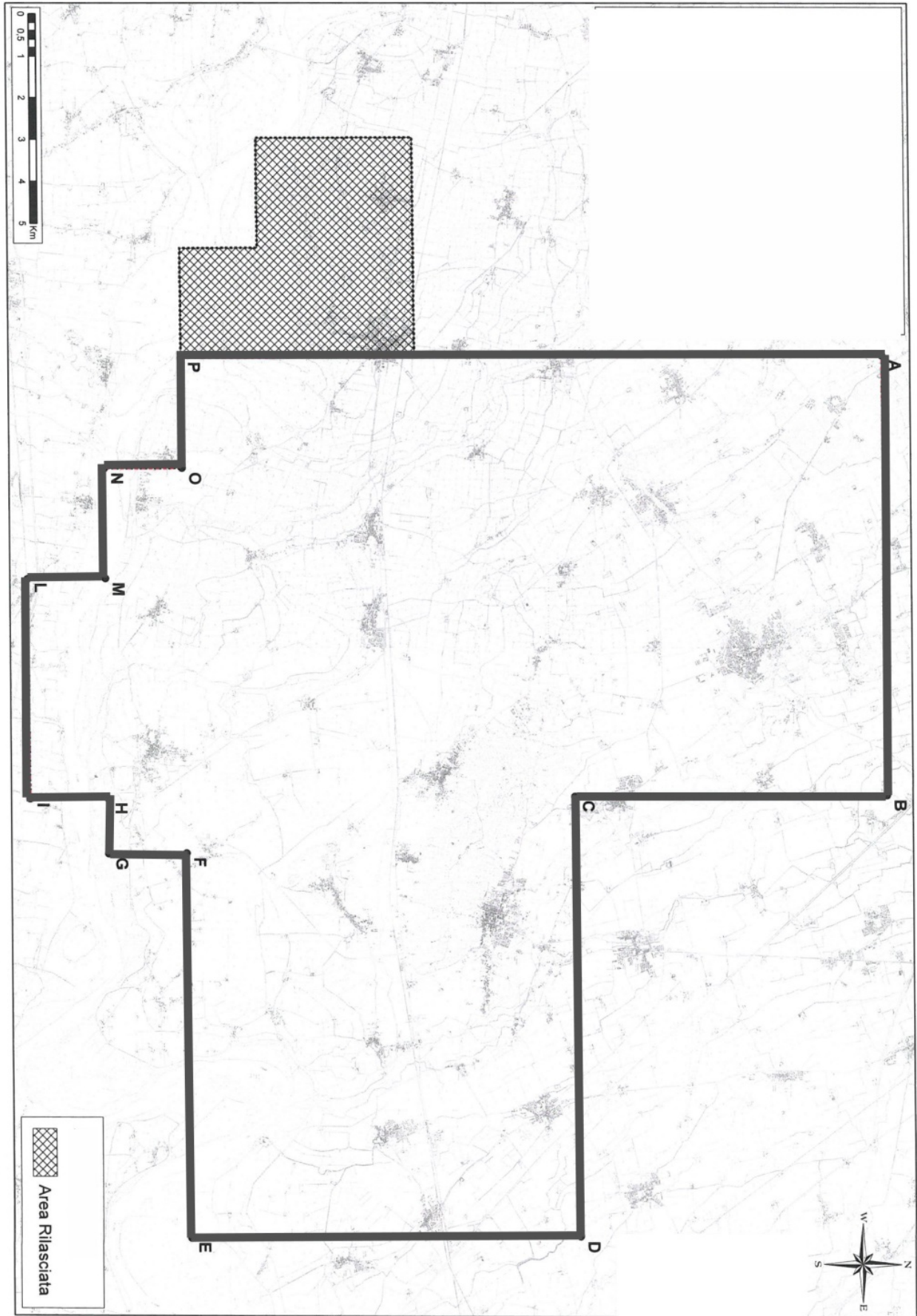
Tav. 1 – Permesso di ricerca BELGIOIOSO