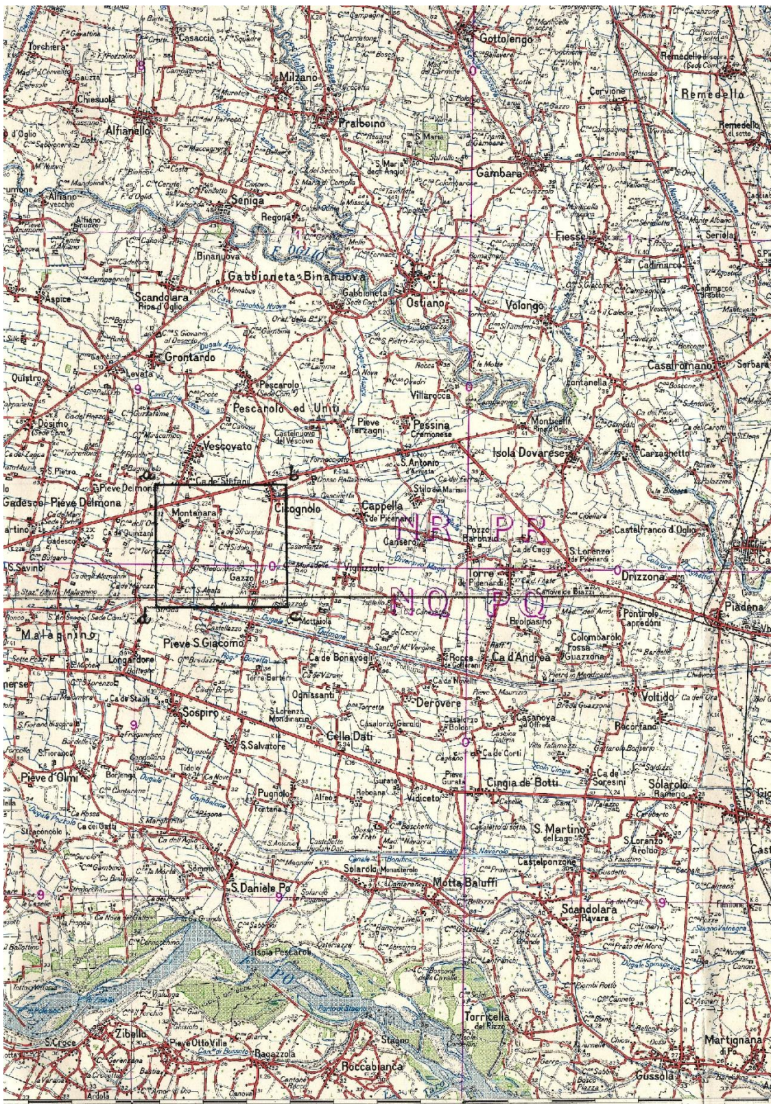
Tav. 3 – Concessione di coltivazione VESCOVATO