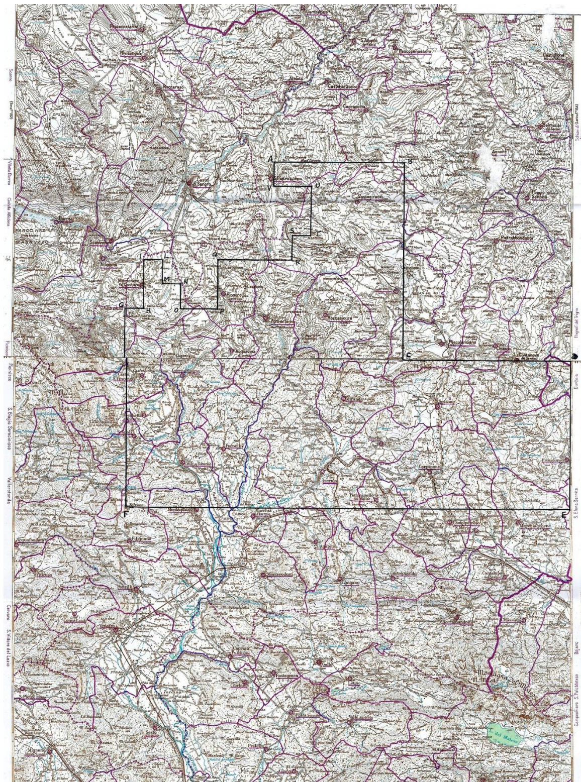
Tav. 2 - Istanza di permesso di ricerca CAROVILLI