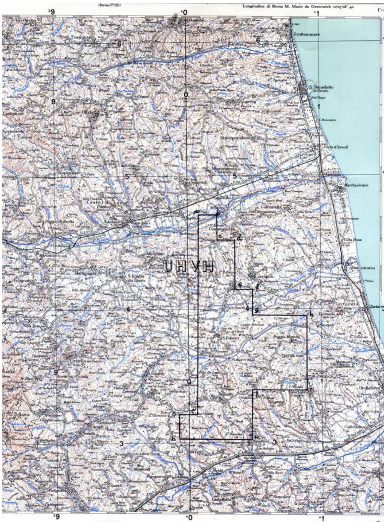
TAV. 1 - Permessi di ricerca «COLLE DEI NIDI»