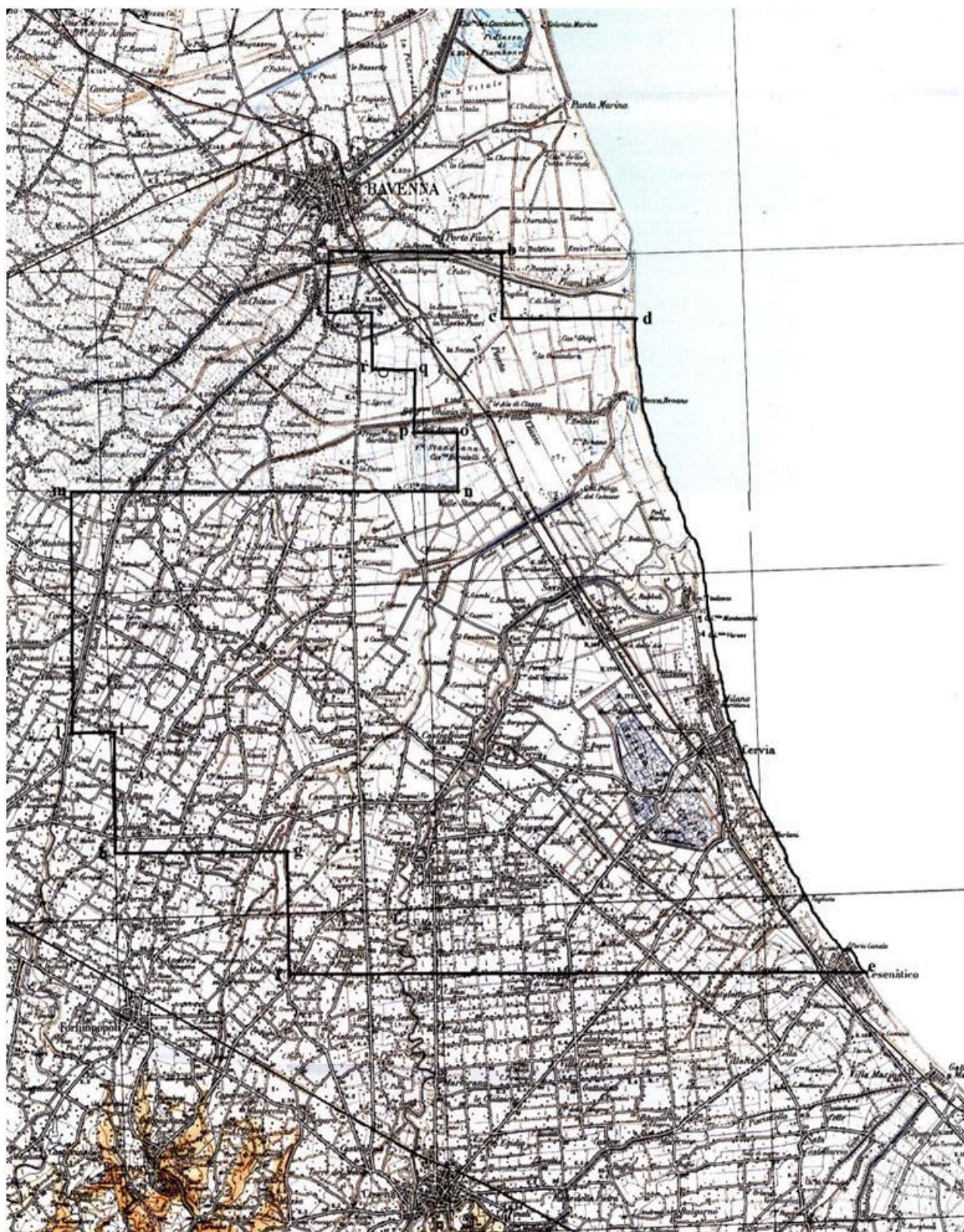
TAV. 1 - Istanza di permesso di ricerca «CASTIGLIONE DI CERVIA»