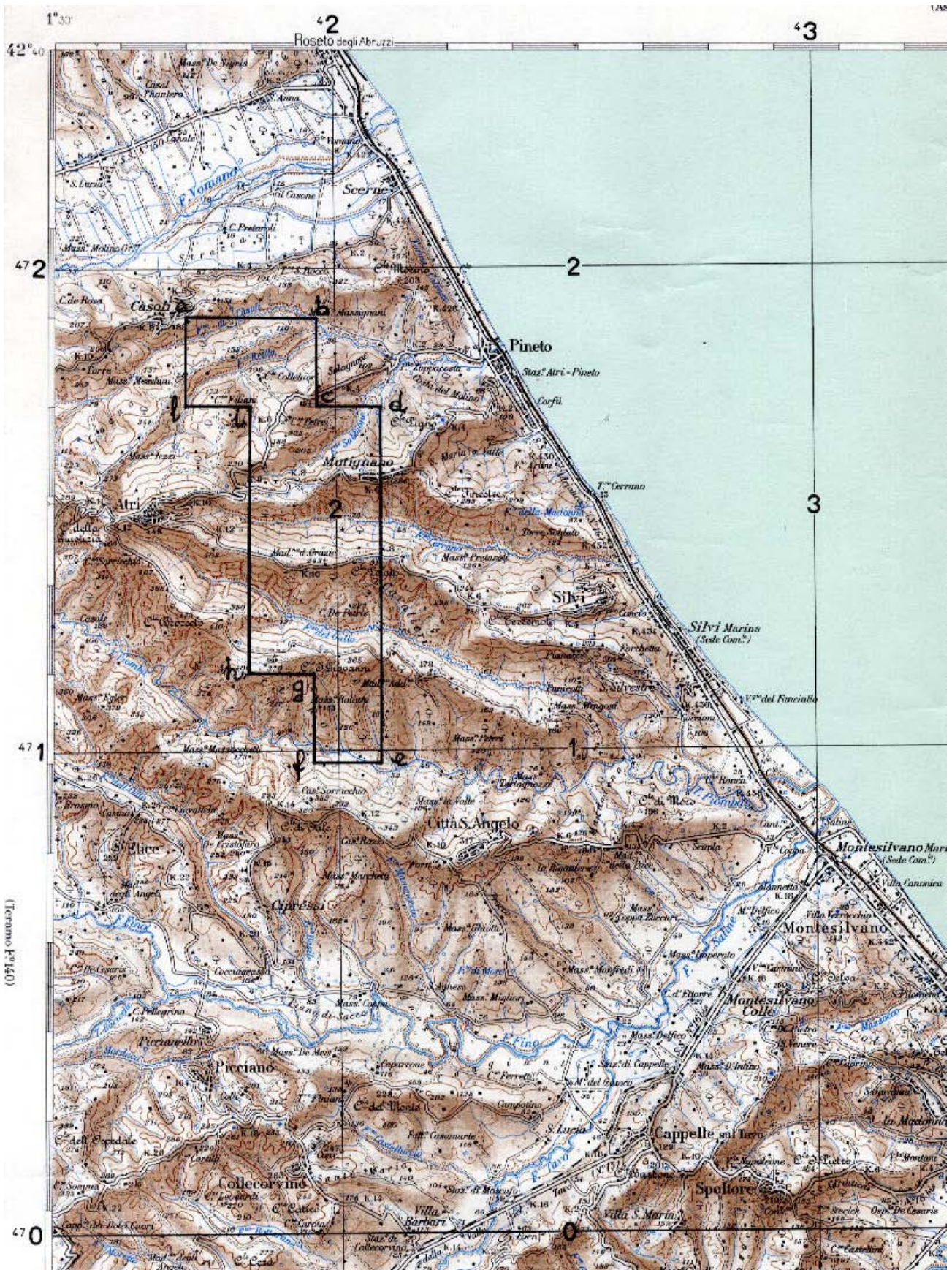
TAV. 2 – Concessione di coltivazione «COLLE S. GIOVANNI»