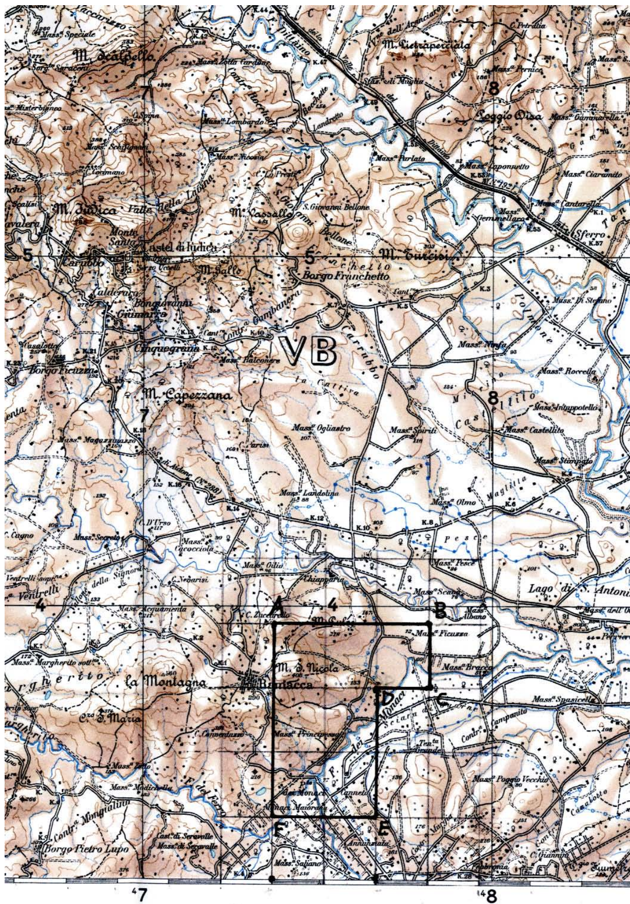
(Caltagirone F. 275) TAV. 4 – Istanza di permesso di ricerca di risorse geotermiche finalizzato alla sperimentazione di impianti pilota denominato «NAFTIA»