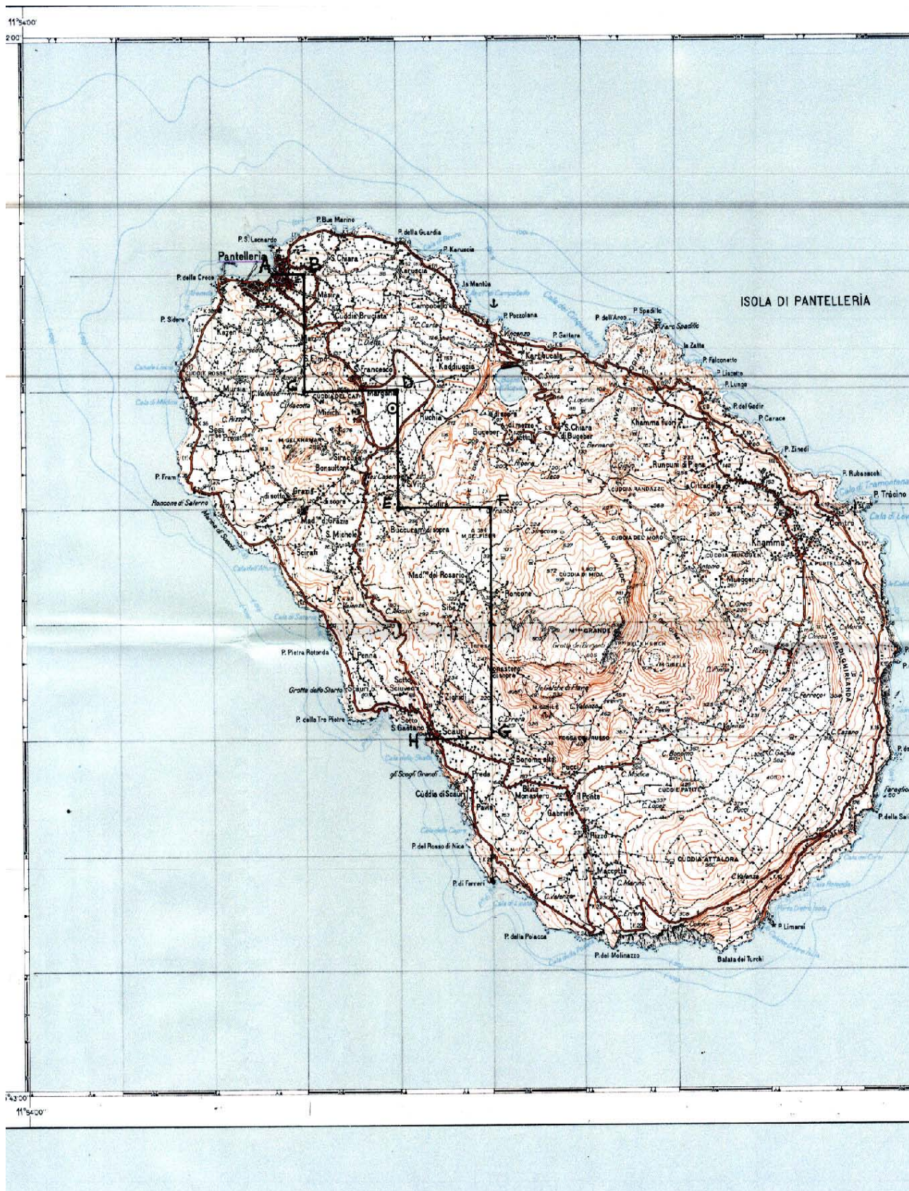
TAV. 5 – Istanza di permesso di ricerca di risorse geotermiche finalizzato alla sperimentazione di impianti pilota denominato «SCAURI PANTELLERIA»