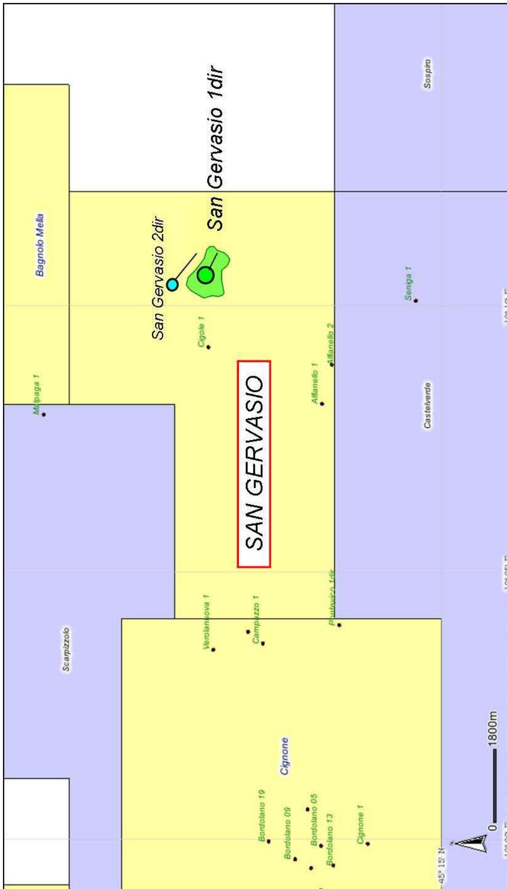
TAV. 3 – Riproduzione del piano topografico del giacimento «SAN GERVASIO» allegato alla Disposizione Direttoriale 27 ottobre 2011