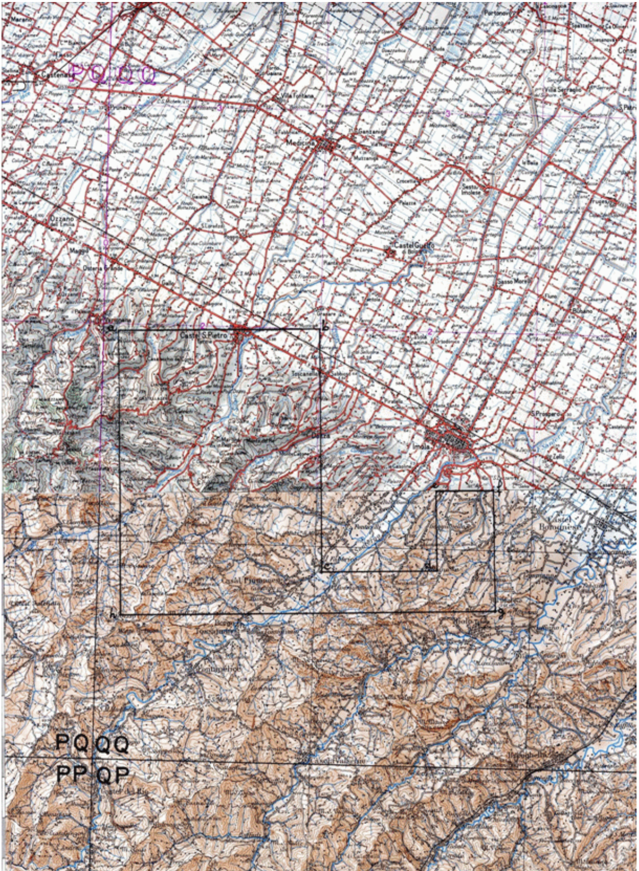
TAV. 1 – Concessione di coltivazione «MEZZOCOLLE»