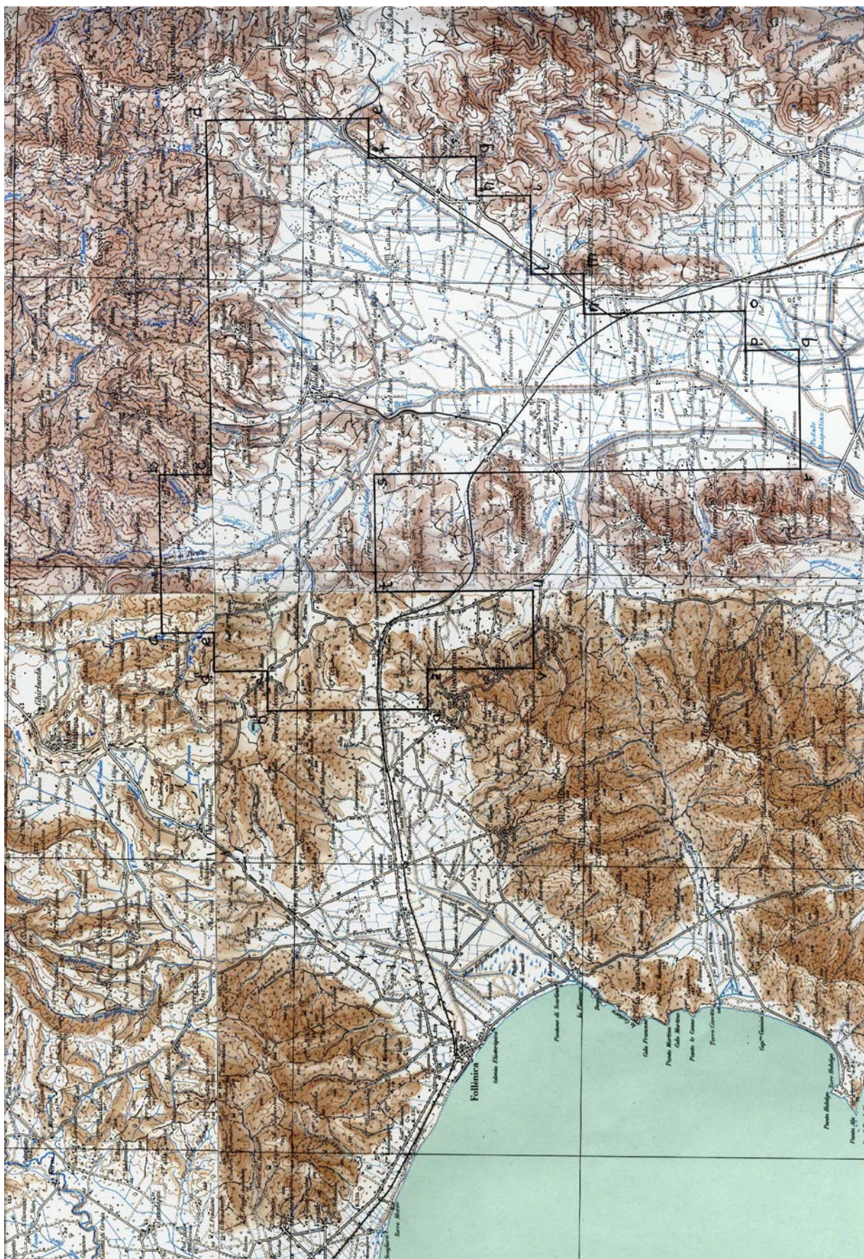
TAV. 2 – Permesso di ricerca FIUME BRUNA