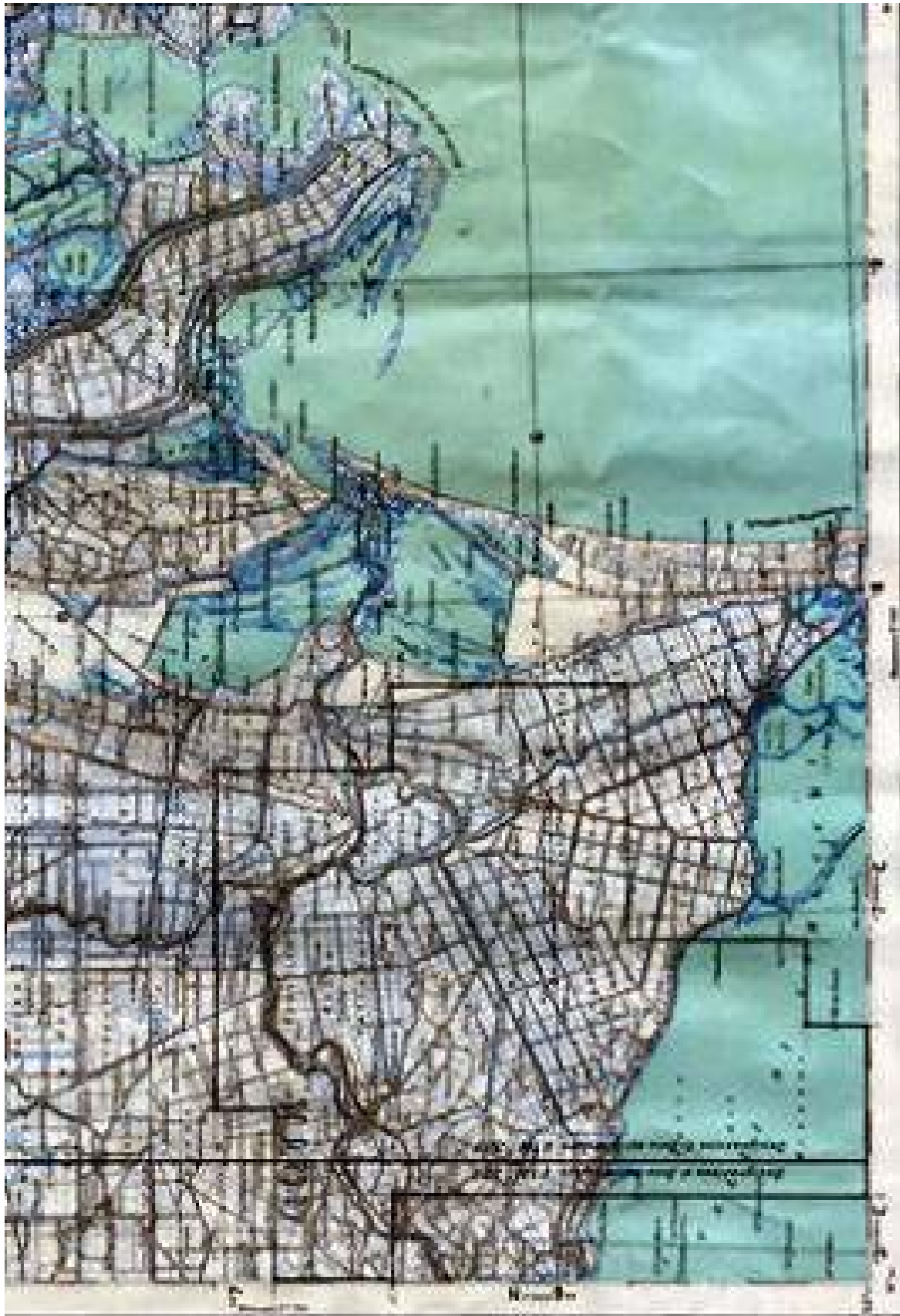
Tav. 2 – Permesso di ricerca CORTE DEI SIGNORI