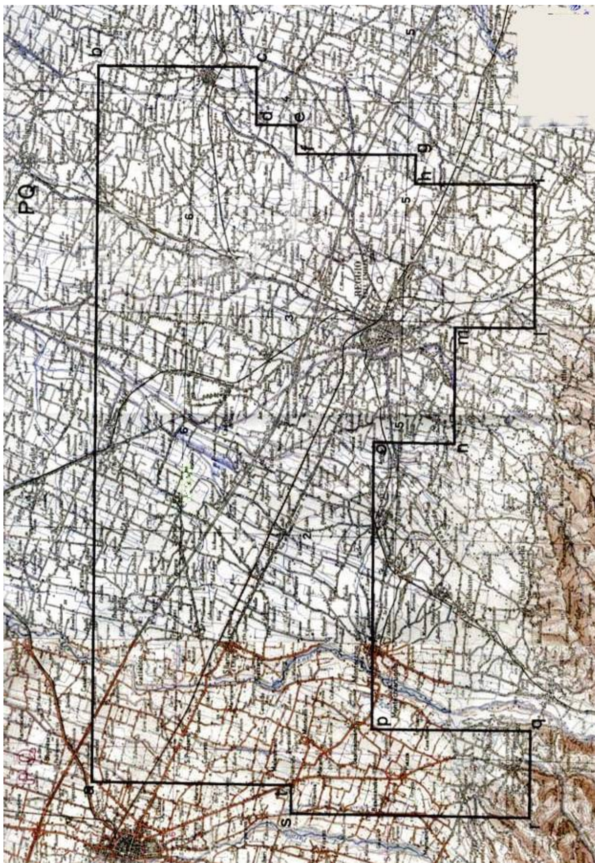
TAV. 2 – Istanza di permesso di ricerca CAPRARA