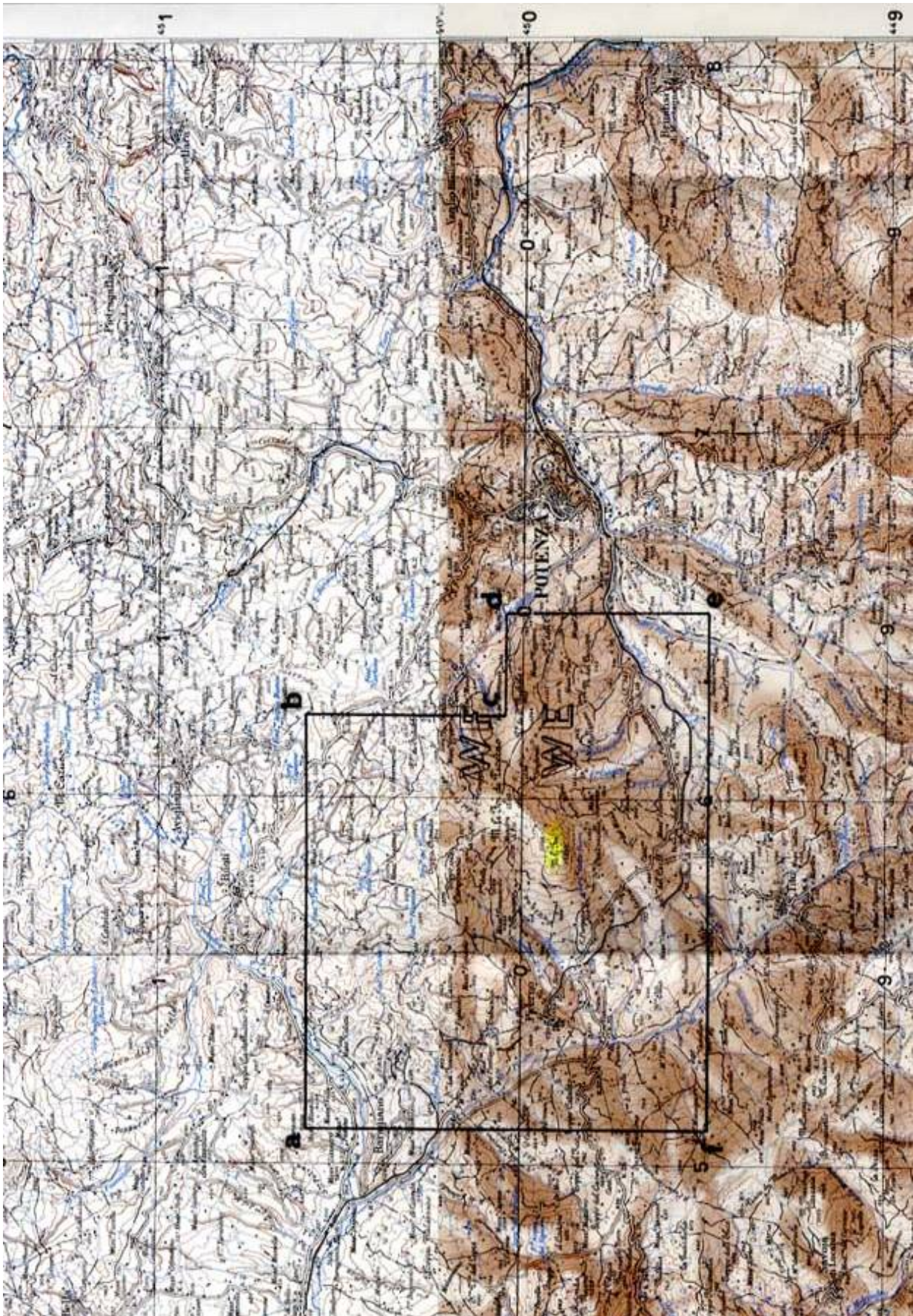
TAV. 1 – Istanza di permesso di ricerca MONTE LI FOI