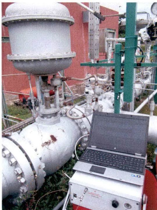
Foto 1 - Gascromatografo portatile µGC 3000

Il campionamento (foto 2) è stato effettuato, dopo il trattamento di disidratazione (ottenuta con glicol dietilenico) e compressione a 50 bar, dalla linea di adduzione alla rete SNAM.