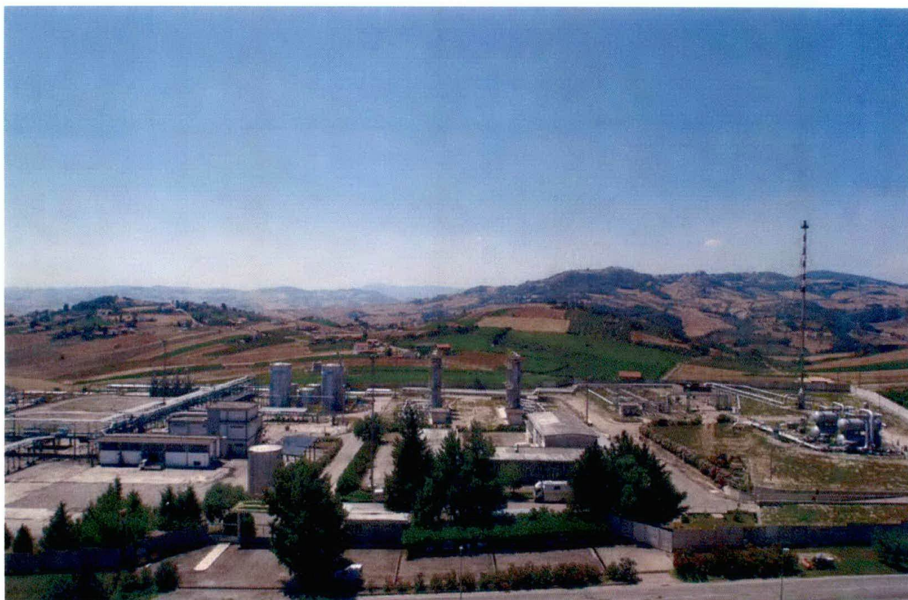
Centrale “Fiume Treste stoccaggio”

Analisi del gas naturale nella centrale di stoccaggio “Fiume Treste stoccaggio” della società STOGIT S.p.A., ubicata nel comune di Cupello (CH).