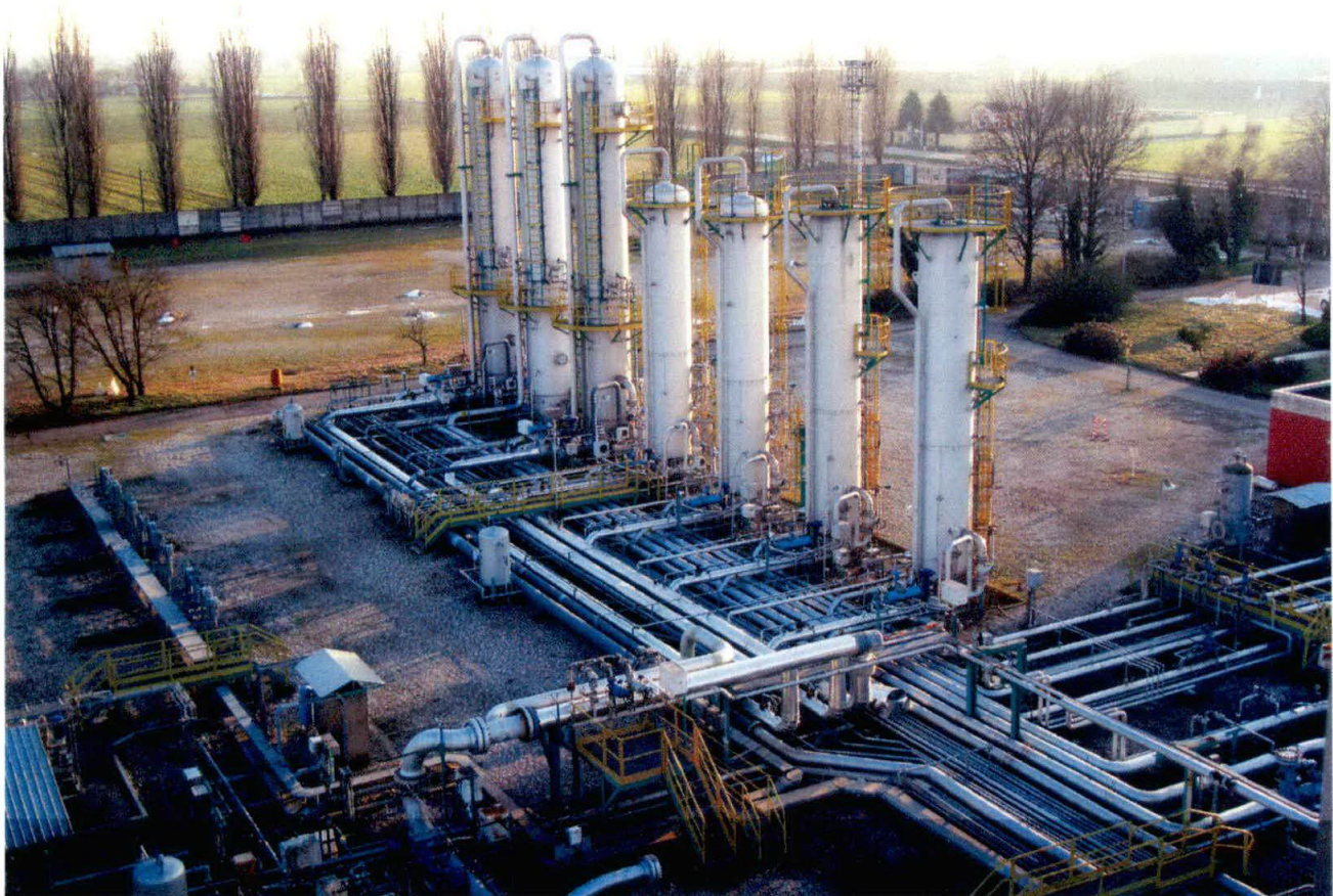
Centrale “Ripalta stoccaggio”

Analisi del gas naturale nella centrale di stoccaggio “Ripalta stoccaggio” della società STOGIT S.p.A., ubicata nel comune di Ripalta Guerina (CR).