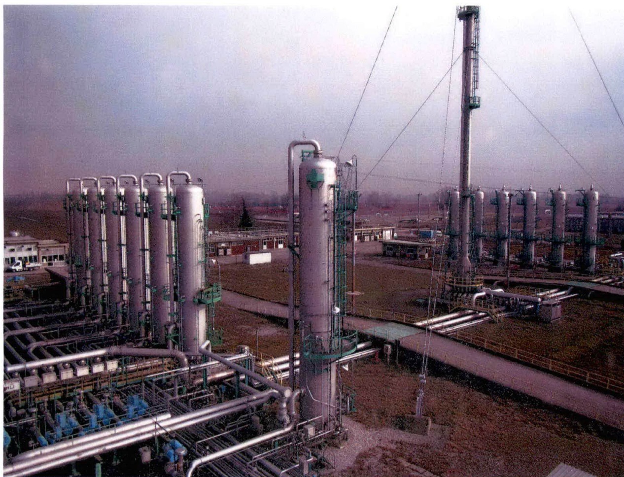
Centrale “Minerbio stoccaggio”

Analisi del gas naturale nella centrale di stoccaggio “Minerbio stoccaggio” della società STOGIT S.p.A., ubicata nel comune di Minerbio (BO).