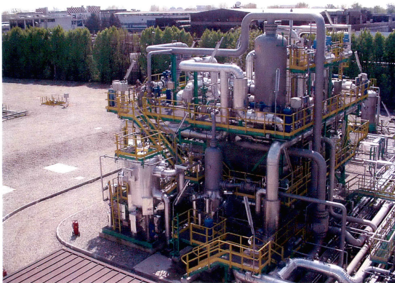
Centrale “Brugherio Stoccaggio”

Analisi del gas naturale nella centrale di stoccaggio “Brugherio Stoccaggio” della società STOGIT S.p.A., ubicata nel comune di Cinisello Balsamo (MI).