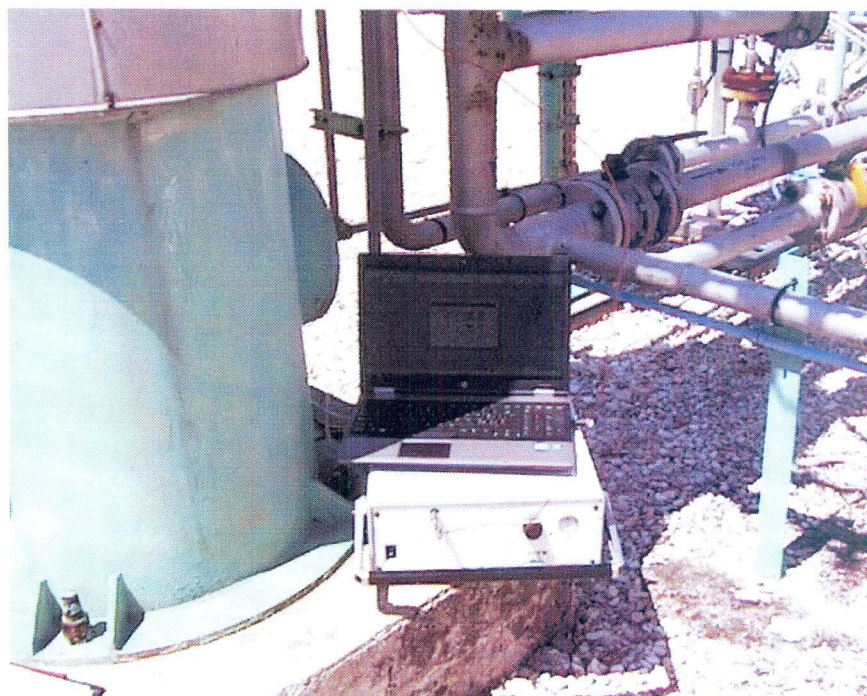
Foto 2 - gascromatografo portatile modello \mu GC 3000 della Agilent

Sono state effettuate due serie di misure dalle ore 12:00 alle ore 12:30; la media dei risultati ottenuti, espressi in percento in moli in condizioni standard ( T=15\text{ }^{\circ}\text{C} , P=101,325\text{ kPa} ) sono riportati nella tabella 1; per confronto, nella stessa tabella, sono riportati i valori rilevati dal gascromatografo in linea della società e gli ultimi valori rilevati con frequenza trimestrale dai laboratori del Gruppo CSA (Rapporto di prova n. 1303247-002 del 17/04/2013).