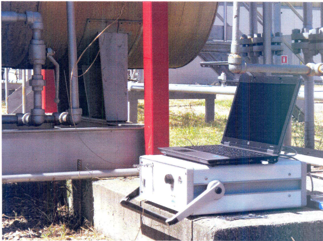
Foto 2 - gascromatografo portatile modello \mu GC 3000 della Agilent

Sono state effettuate due serie di misure dalle ore 10:30 alle ore 11:00; la media dei risultati ottenuti, espressi in percento in moli in condizioni standard ( T=15\text{ }^{\circ}\text{C} , P=101,325\text{ kPa} ) sono riportati nella tabella 1; per confronto, nella stessa tabella, sono riportati anche i valori rilevati mensilmente dalla Innovhub Stazioni Sperimentali per l'industria – Div. Stazione Sperimentale per i Combustibili (Rapporto di prova n. 201301809 del 18/04/2013).