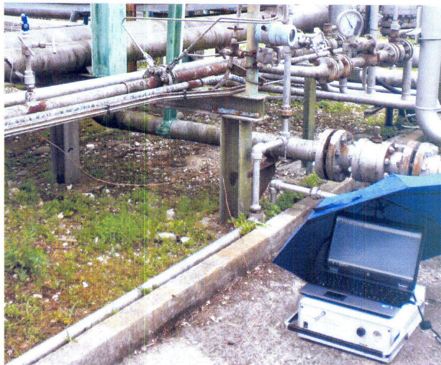
Foto 2 - gascromatografo portatile modello \mu GC 3000 della Agilent

Sono state effettuate due serie di misure dalle ore 15:40 alle ore 16:10; la media dei risultati ottenuti, espressi in percento in moli in condizioni standard ( T=15\text{ }^{\circ}\text{C} , P=101,325\text{ kPa} ) sono riportati nella tabella 1; per confronto, nella stessa tabella, sono riportati i valori rilevati mensilmente dalla società LASER LAB (Rapporto di prova n. 10658/13 del 16/04/2013).