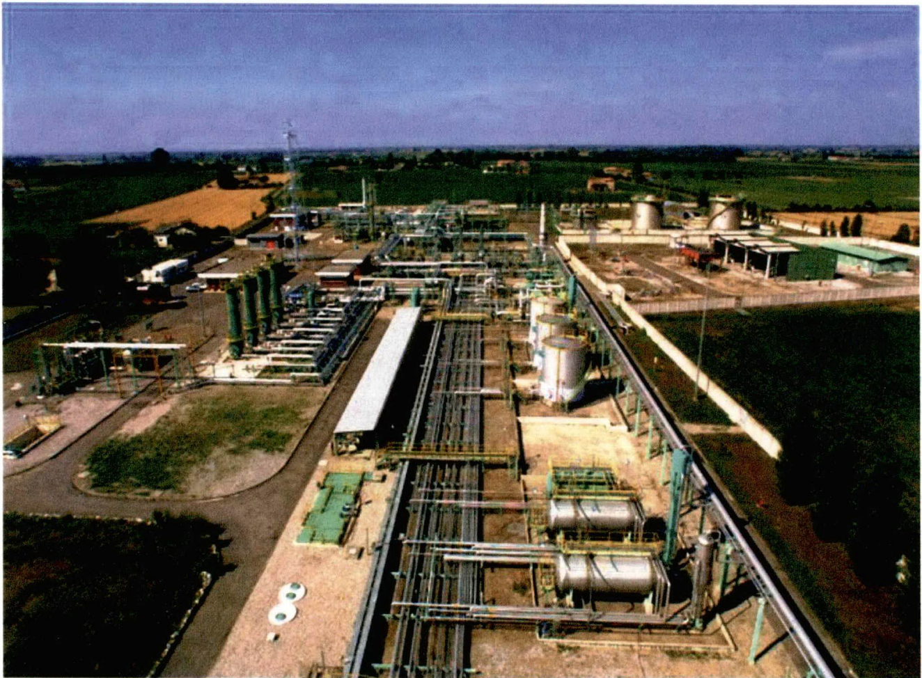
Centrale “Cortemaggiore stoccaggio”

Analisi del gas naturale nella centrale di stoccaggio “Cortemaggiore stoccaggio” della società SNAM S.p.A., ubicata nel comune di Cortemaggiore (PC).