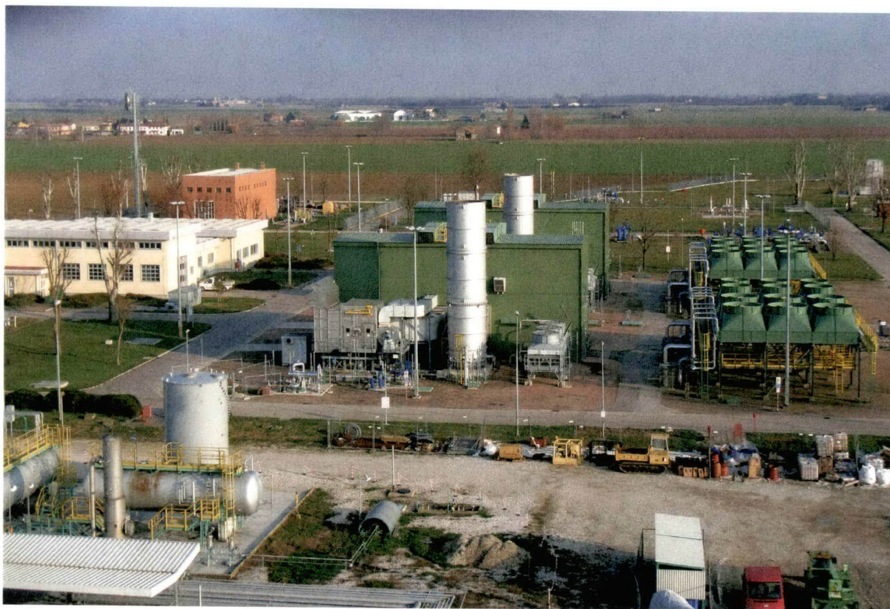
Centrale “Sergnano stoccaggio”

Analisi del gas naturale nella centrale di stoccaggio “Sergnano stoccaggio” della società STOGIT S.p.A., ubicata nel comune di Sergnano (CR).