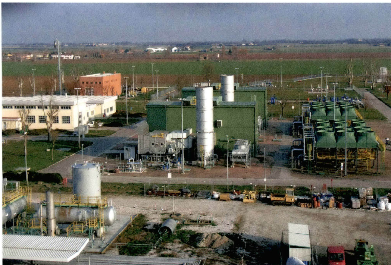
Centrale “Sabbioncello stoccaggio”

Analisi del gas naturale nella centrale di stoccaggio “Sabbioncello stoccaggio” della società STOGIT S.p.A., ubicata nel comune di Tresigallo (FE).