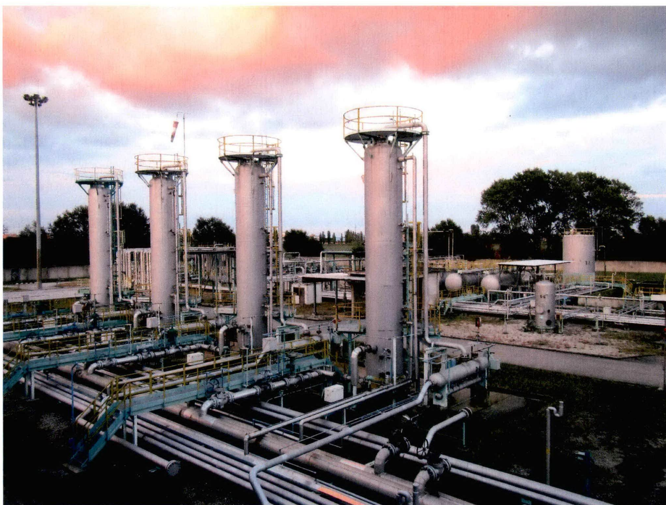
Centrale “Ravenna Mare”

Analisi del gas naturale nella centrale di trattamento “Ravenna Mare” della società eni S.p.A., ubicata nel comune di Ravenna in località Lido Adriano.