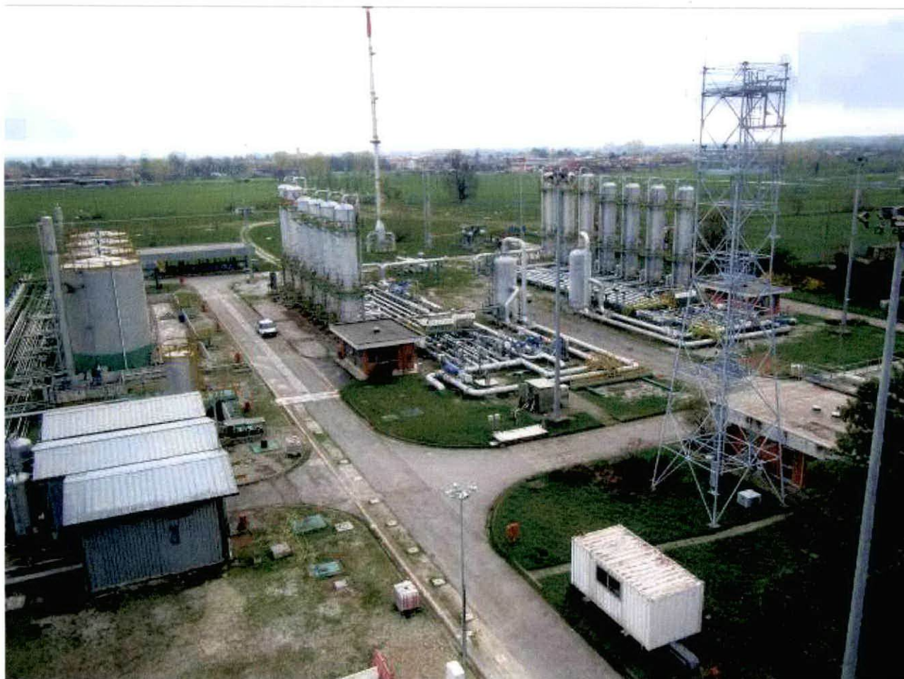
Centrale “Sergnano stoccaggio”

Analisi del gas naturale nella centrale di stoccaggio “Sergnano stoccaggio” della società STOGIT S.p.A., ubicata nel comune di Sergnano (CR).