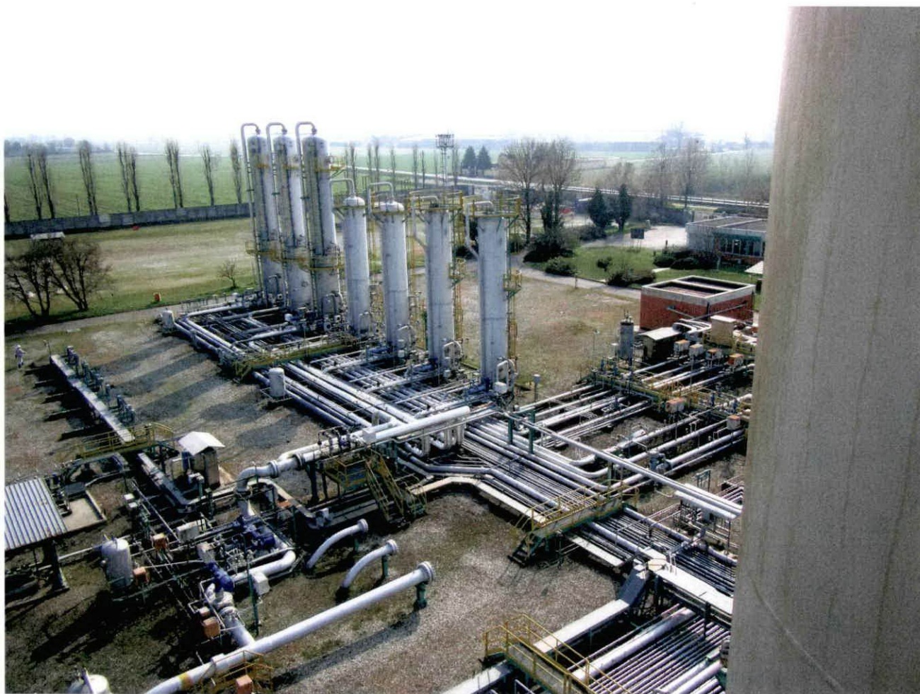
Centrale di stoccaggio “Ripalta stoccaggio”

Analisi del gas naturale nella centrale di stoccaggio “Ripalta stoccaggio” della società STOGIT S.p.A., ubicata nel comune di Ripalta Guerina (CR).