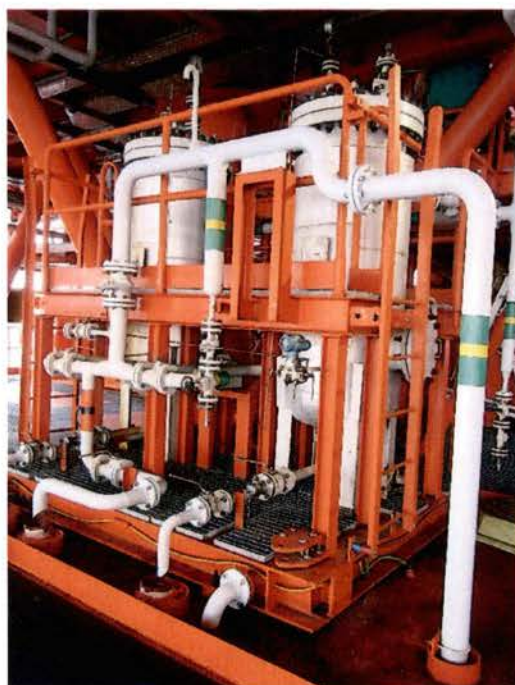
Foto 4 - Filtri a carbone attivo