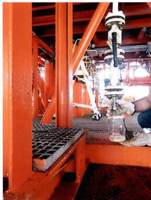
Foto 3 - Campionamento a valle filtri