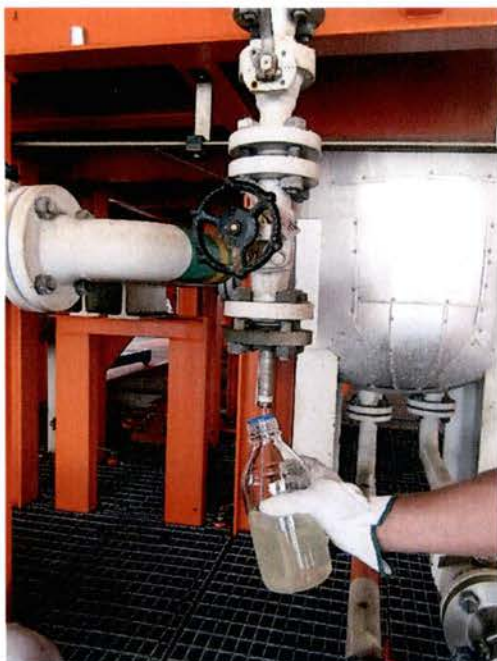
Foto 2 - Campionamento a monte filtri

quanto autorizzato dal Decreto di pronuncia di compatibilità ambientale del Ministro dell'ambiente e della tutela del territorio e del mare di concerto con il Ministro dei beni e delle attività culturali, D.M. 227 del 17/09/2014; volume max. giornaliero autorizzato per il 2016 pari a 32 m 3 .