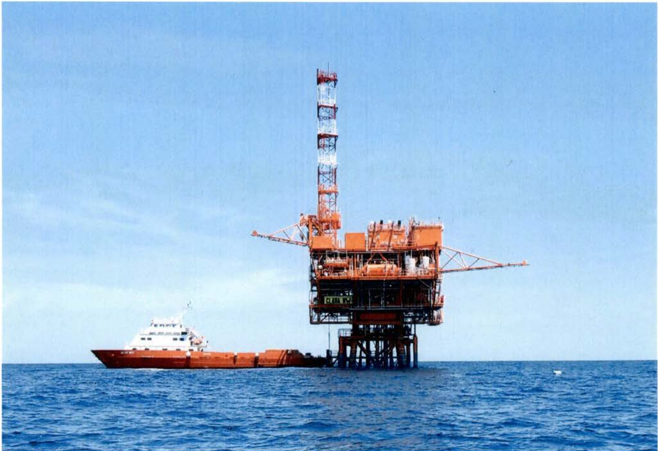
Piattaforma “Clara NW”

Attività ispettiva sulla piattaforma di produzione “Clara NW” della società eni S.p.A.