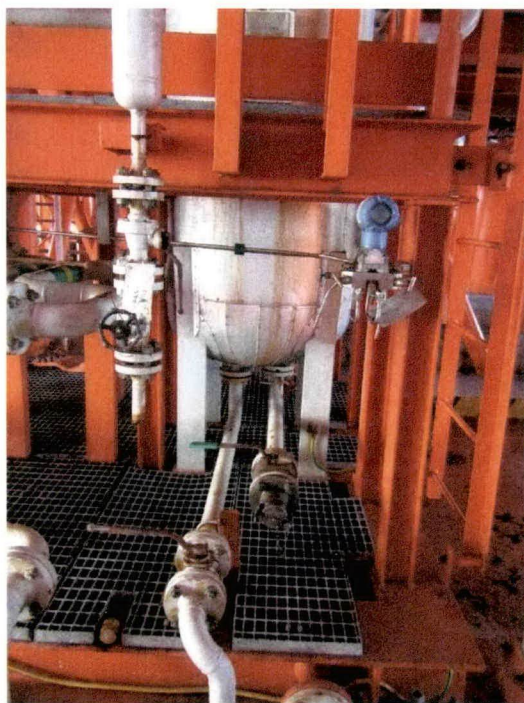
Foto 4 - Impianto di trattamento con filtri a carbone attivo