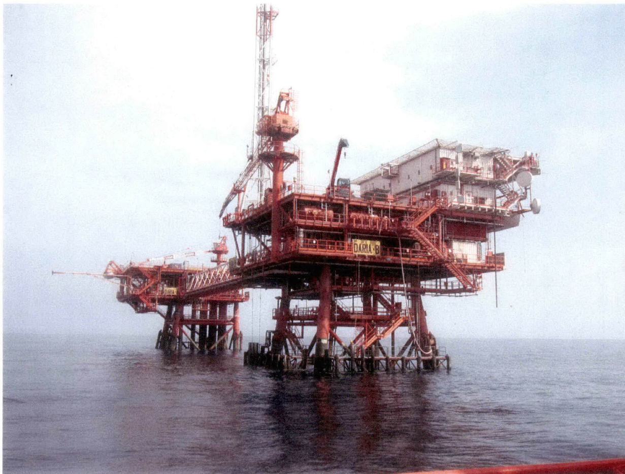
Piattaforma Daria B

Attività ispettiva sulla piattaforma di produzione “Daria B” della società eni S.p.A.