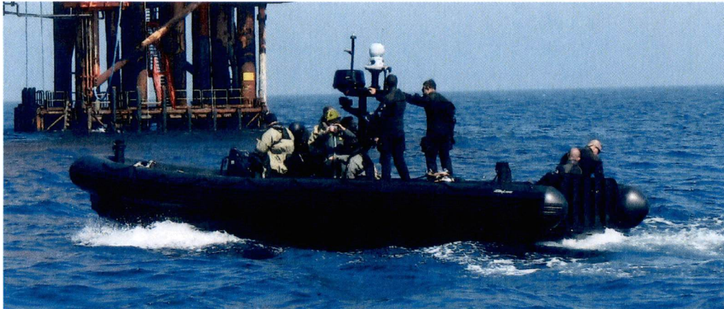
Foto 2 - Gruppo Operativo Subacquei della Marina Militare Italiana