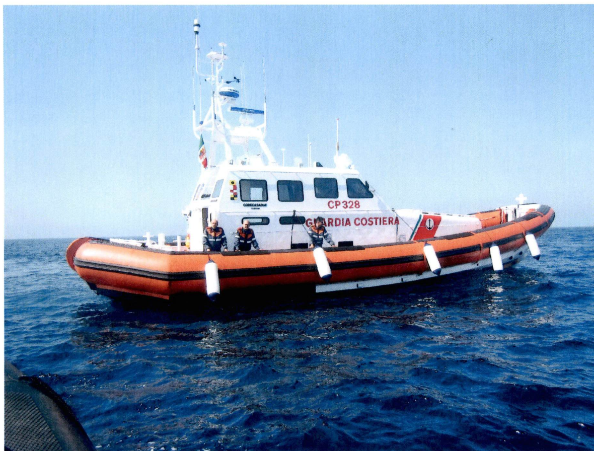
Foto 1 - Motovedetta CP 328