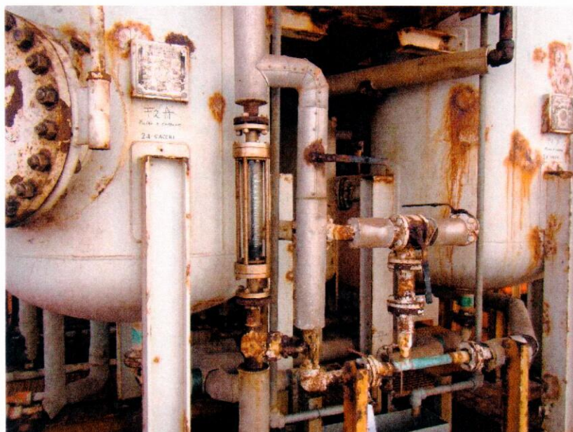
Foto 4 - Impianto di trattamento con filtri a carbone attivo